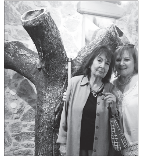
Το εισαγόμενο φελλόδεντρο απ' όπου βγαίνουν οι φελλοί.

Chardonnay και από τα ερυθρά, το Amethystos rouge, το Amethystos cava, το Chateau Julia Merlot, το Chateau Julia Reforco Agiorgitiko και στο τέλος το Οινότρια Γη Cabernet Sauvignon Agiorgitiko.