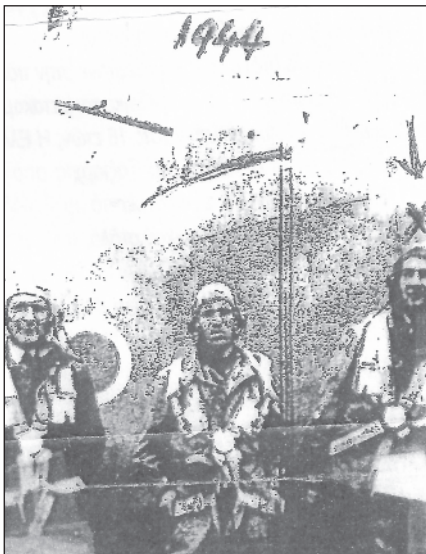
Στο αεροδρόμιο στο Χασάνι (αεροδρόμιο Ελληνικού)

Είμαι ολομόναχος εδώ. Κέρδισα τη φιλία καλών ανθρώπων που μου φέρονται πολύ εντάξει. Στα νιάτα μου είχα αναπτύξει σωματειακή δράση σε σωματεία ελληνικά και αυστραλέζικα. Ήμουν γραμματέας, κρατούσα τα πρακτικά και τα μετέφραζα στα αγγλικά. Η ζωή κυλά κανονικά και λέω Δόξα τω Θεώ, είμαι ευχαριστημένος.