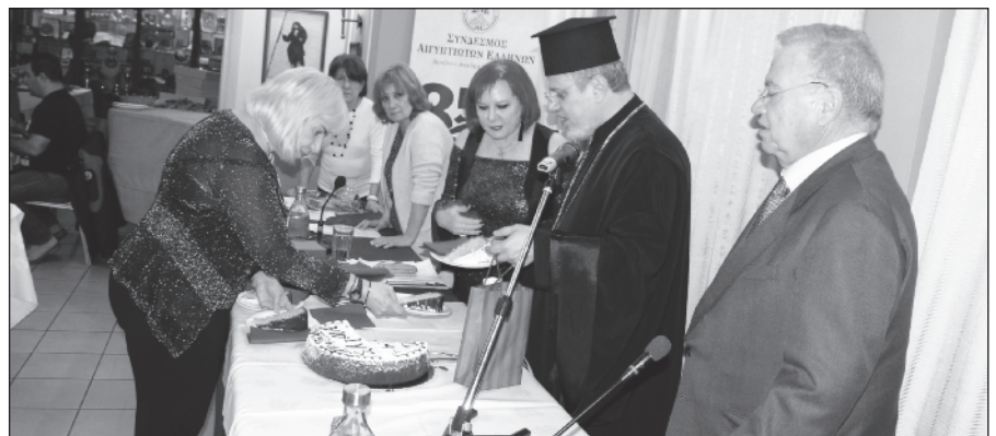
Το φλουρί της πίτας του ΔΣ βρέθηκε στο κομμάτι του Πατριάρχη Αλεξανδρείας κ.κ. Θεοδώρου Β΄.

Αρχικά και καθηκόντως θα σας μεταφέρω τις ευχές, τις ευλογίες και την αγάπη, της Αυτού Θεοπάτη Μακαριότητας του Πάπα και Πατριάρχη Αλεξανδρείας και πάσης Αφρικής κ.κ. Θεοδώρου του Β΄ , του ποιμενάρχου μας, του κυβερνήτη του ηπδαλίου της ιστορικής Εκκλησίας της Αλεξάνδρειας, ο οποίος την Κυριακή γιορτάζει τα ονομαστήριά του, και θα βρίσκεται, όπως συνθίζει κάθε χρόνο, σε μια επαρχία στην Αφρική. Φέτος θα είναι στο Κογκό, Μπραζαβίλ και στη συνέχεια θα κάνει περιοδεία στη μεγάλη δημοκρατία του Κογκό, που είναι μία ακανής έκταση, σχεδόν όσο η Ευρώπη