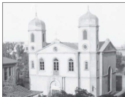
Ιερός Ναός Αγίου Γεωργίου Μεγάλλας Κεμπίρ Αιγύπτου.

προσκυνήσουμε. Τους Άρτους ευγενικά προσέφερε ο Σύλλογος των Σουεζιανών, που ιδιαίτερως ευχαριστούμε. Παραβρέθηκαν αρκετοί συμπατριώτες και φίλοι.