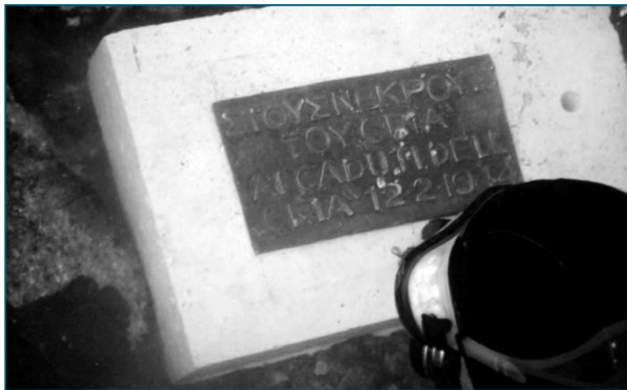
Τοποθέτηση της αναμνηστικής πλάκας, με κάποιον Ιταλό που ήταν ο παππούς του στο ναυάγιο και χάθηκε.

Επίσης, τραγική φιγούρα ο Giulio Antoniacci , τον οποίο επιβίβασαν στο πλοίο οι Γερμανοί στη Ρόδο, αλλά λόγω του απίστευτου συνωστισμού και της υπερφόρτωσης του πλοίου τον κατέβασαν και τον έστειλαν στην Αθήνα με αεροπλάνο την επόμενη μέρα. Όταν προσγειώθηκε στο Τατόι τον φόρτωσαν το επόμενο πρωί σε φορτηγό, μαζί με άλλους αιχμάλωτους Ιταλούς και τον έστειλαν στην παραλία του Χάρακα στα Λεγραινά για να θάψει τους συντρόφους του, που χάθηκαν το προηγούμε-