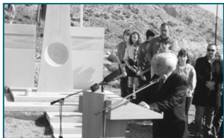
Ο ΠτΔ Προκόπης Παυλόπουλος επισκέπτεται το μνημείο.

Η Πρόεδρος ευχαρίστησε τον ερευνητή λέγοντας ότι ο Αριστοτέλης μάς τιμά με τις πράξεις και την έρευνά του και ως ελάχιστο δείγμα αναγνώρισης της προσφοράς και της δράσης του, του παραδίδουμε μια αναμνηστική πλακέτα με το σχολείο μας, από όπου αποφοίτησαν οι γονείς του, τα Ελληνικά