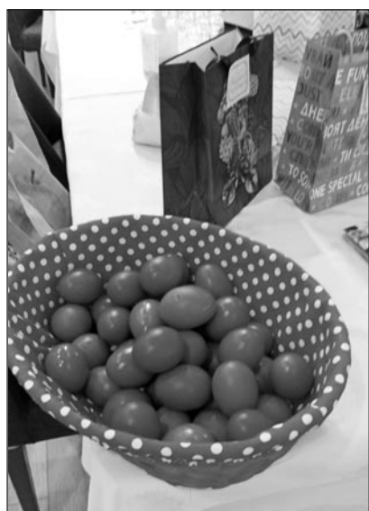
Ευχαριστούμε τον Τζώνυ για τα ωραία κόκκινα αυγά.

Ευχαριστούμε πάρα πολύ και ευχόμαστε να περάσετε όμορφα. Να είστε πάντα καλά και χαρούμενοι.