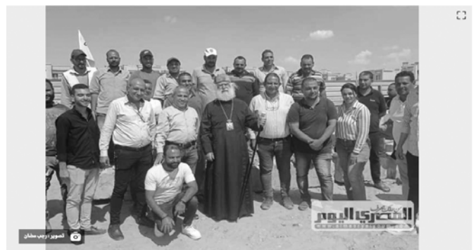
على مساحة 1500 مترا .. تخصص 5 آلاف مترا لبناء مقر باباوية جديدة ايوها بكنيسة الروم الارثوذكس وكاتدرائية القديس يوحنا المعمدان في العاصمة الادارية (صور)