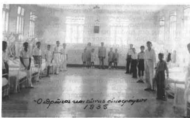
Ο πρώτος κοιτώνας του οικοτροφείου, 1935

της στιγμής. Ο διάδρομος, καταλήγει σε μια τετράγωνη επιφάνεια, αρκετά μεγάλη και καλυμμένη με «balatia». Απ' εκεί αρχίζει η σκάλα της κυρίας εισόδου, που οδηγεί στο σχολικό κτίριο.