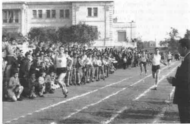
Σχολικοί αγώνες, 1960