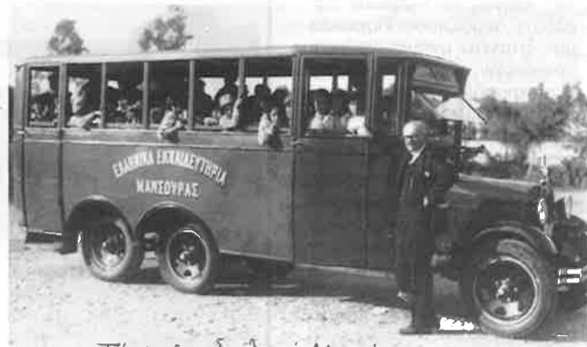
Το πρώτο σχολείο Αιγυπτιακό