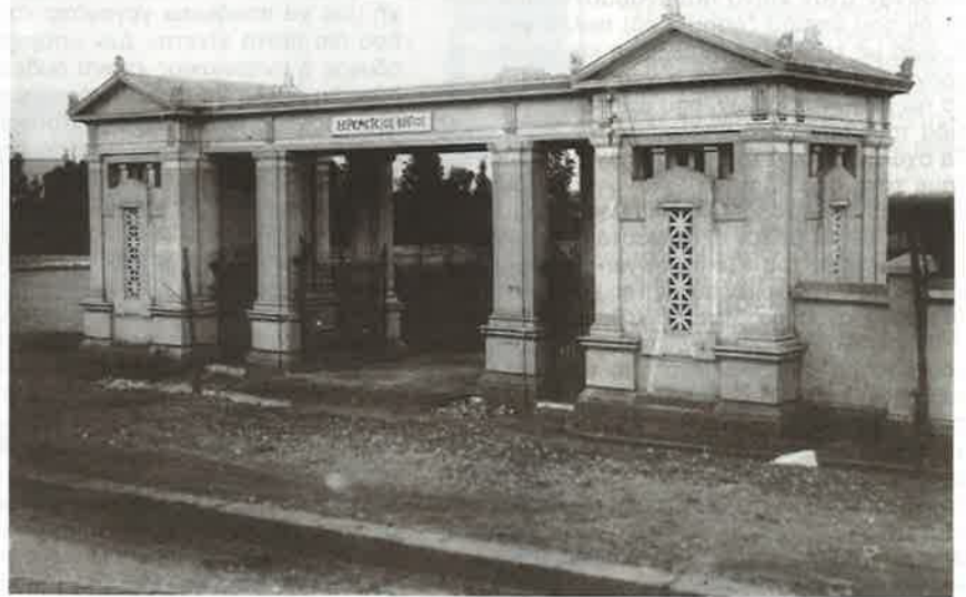
Ο Σεραμέτιος κήπος της Μανσούρας

Εδώ και πολλά χρόνια οι άλλοτε συστηματικές και άλλοτε περισσότερο σποραδικές επαφές με παλιούς συμμαθητές και άλλους γνώριμους, μεγαλύτερους στην ηλικία ή νεότερους από εμένα, συμπολίτες από την Μανσούρα χαρακτηρίζονται πάντοτε από μία εγκάρδιότητα και μία, θά 'λεγε κανείς, νοσταλγία που αυθόρμητα ξεπηδούσε για κείνους και για