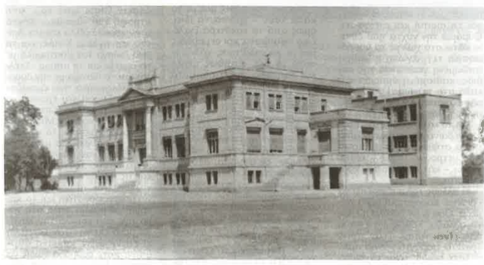
Τα ιστορικά Εκπαιδευτήρια της Ελληνικής Κοινότητας Μανσούρας