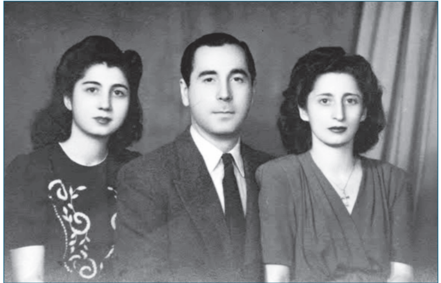
Γύρω στα 1947 τα τρία αδέρφια φωτογραφίζονται στη Μανσόυρα.

Το 1949 βεβαίως πλησιάζει, με το τέλος των Διομολογήσεων και των Μικτών