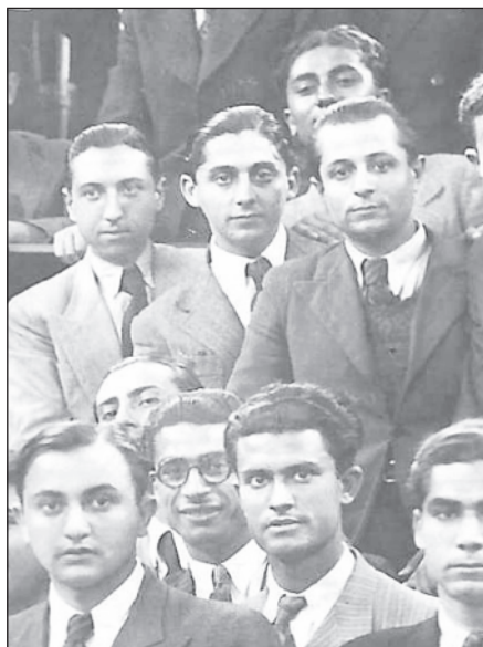
Φοιτητές Ιατρικής Σχολής Αθηνών. Τμήμα ομαδικής φωτογραφίας, γύρω στο 1936.

Για την περίσταση το ατελιέ ραπτικής της Κας Τ. θαυμάστριας των μελλοντικών γιατρών, θα δανείσει βραδυνά φορέματα στις κοπελίτσες: Προσοχή κορίτσια, τα φορέματα και τα μάτια σας! Τα παραδίδω αύριο!