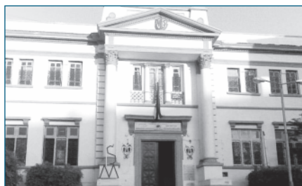
Τα Ελληνικά Εκπαιδευτήρια όπως είναι σήμερα

Επισημαίνουμε ότι, γενικότερα, το ενδιαφέρον για τη νηπιακή εκπαίδευση δεν αντανάκλουσε μόνο ωρίμανση αντιλήψεων σχετικά με τη σημασία της προσχολικής αγωγής, αλλά επιβαλλόταν από την ανάγκη ενσωμάτωσης πληθυσμών που δεν ήταν απόλυτα ελληνοφώνοι. Στην εισηγητική έκθεση των νομοσχεδίων Τσιριμώκου του 1913 αναφέρεται ότι «τα νηπιαγωγεία ταύτα κύριον σκοπόν θα έχωσι να συνηθίζωσιν εις το ομιλείν την ελληνικήν τους παιδιάς εκείνους οτινες ανεπαρκώς εν των οίκω έχουσιν ασκηθεί εις τούτο, ούτως ώστε να μη προσκρούει εις δυσχερείας και να μη απόκειται εις αποτυχίαν η δημοτική εκπαίδευσις εις τα μέρη ταύτα» .