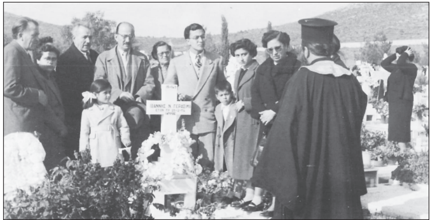
Οι φίλοι του θυμούνται: Φωτογραφία μνημοσύνου σταλμένη στην οικογένεια στην Αίγυπτο

Απόσπασμα της νεκρολογίας (διατηρείται η ορθογραφία της εποχής, χωρίς τα σημεία στίξεως...)